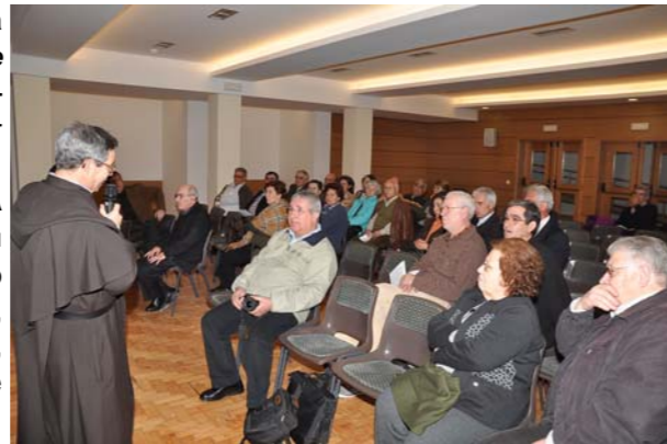
Aspecto da Assembleia-geral