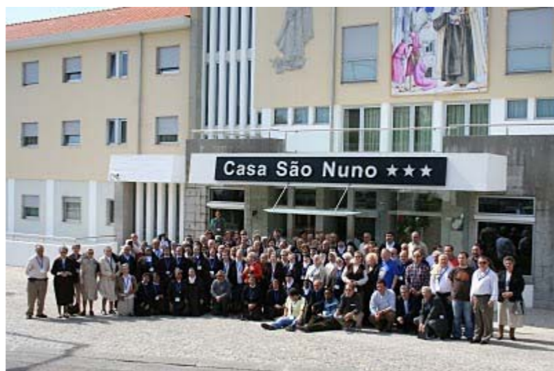
Foto da Família Carmelita Ibérica presente em Fátima

Pela primeira vez, a Direcção da AACARMELITAS participou no encontro anual Ibérico da Família Carmelita. Foi um tempo muito sublime para nós, com vontade de voltar a participar nestes convívios ibéricos da Família Carmelita.