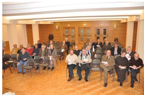
Aspecto da Assembleia-geral